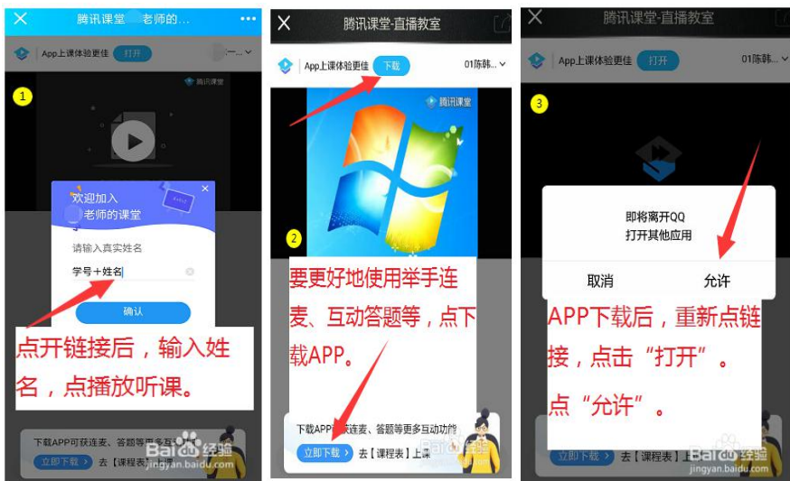
步骤（1） 步骤（2） 步骤（3）